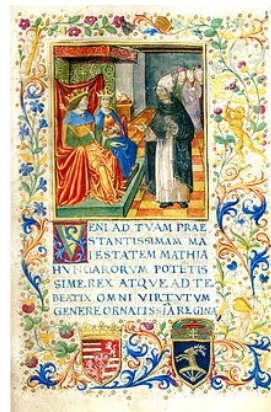
Ransanus-kódex Mátyás király corvinái közül

Használd a könyvtár katalógusát, és ha van kedved, írd meg neveddel, iskolád nevével, és a könyvtár nevével együtt az eredményeket november 30-áig a hirlevel@szegepi.hu e-mail címre.