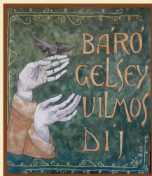
Timár Ildikó: Bárány Gelsey Vilmos Díj (nemzekép, 200 cm×200 cm)