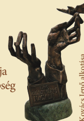
Kovács Jenő alkotása

A Báró Gelsey Vilmos Nagydíjra olyan pedagógusok vagy gazdasági szakemberek jelölhetőek, akiknek sok éve tartó szakmai életútjuk már eddig is elismeréseket hozott. A díjazott az oklevél és a kisplasztika mellett 2 millió forint pénzzutalmat kap. A díj átadására minden év decemberében, az alapító báró Gelsey Vilmos születésnapja alkalmából kerül sor, a második alkalommal 2015. december 8-án. Az átadás ünnepség keretében lesz Szegeden, a Szeged-Csanádi Egyházmegye székhelyén.