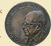
Kovács Jenő alkotása

A Báró Gelsey Vilmos-díjra olyan pedagógusok vagy gazdasági szakemberek jelölhetőek, akik kiváló szakmai teljesítményükkel, a köznevelés szolgálatában nyilvánított elkötelezettségükkel már eddig is kivívták munkatársaik, az általuk szolgált köznevelési intézmények közösségeinek elismerését. A díjazott az oklevél és a plakett mellett 1 millió forint pénzzutalmat kap.