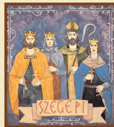
Timár Ildikó: SZEGEPI (nemzekép, 200×200 cm)