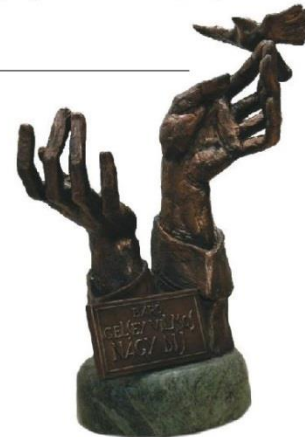
Kovács Jenő alkotása

A Báró Gelsey Vilmos Nagydíjra olyan pedagógusok vagy gazdasági szakemberek jelölhetőek, akiknek sok éve tartó szakmai életútjuk már eddig is elismeréseket hozott. A díjazott az oklevél és a kisplasztika mellett 2 millió forint pénzjutalmat kap. A díj átadására minden évben az alapító báró Gelsey Vilmos születésnapján kerül sor, első alkalommal 2014. december 17-én. Az átadás ünnepség keretében lesz Budapesten, a Gellért Szállóban.