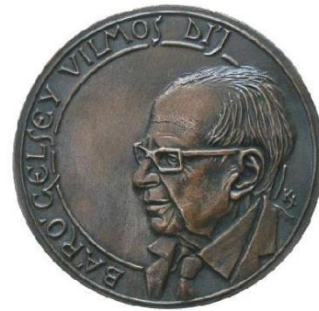
Kovács Jenő alkotása

A díjazott az oklevél és a plakett mellett 1 millió forint pénzjutalmat kap.