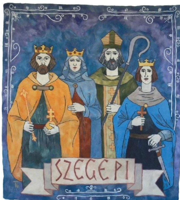
Timár Ilkó: SZEGEPI (nemezkép, 200×200 cm)